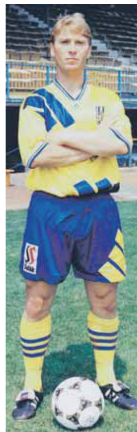
V drese Dunajskej Stredy.

„Viaceri boli prekvapení. Tí, čo ma poznali z futbalových trávnikov, si ma doberali, či som prišiel na exkurziu alebo ako manažér, ktorý vyhľadáva talenty. Povedal som im, že to nie je nijaká sranda, ale že som zamestnanec tak, ako oni. Skrátka, jeden z nich, iba