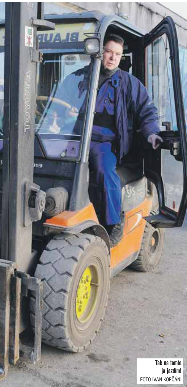
Tak na tomto ja jazdím!

robit, ale nie raz som si opakoval, že som urobil chybu, keď som sa pobral do iného štátu.“