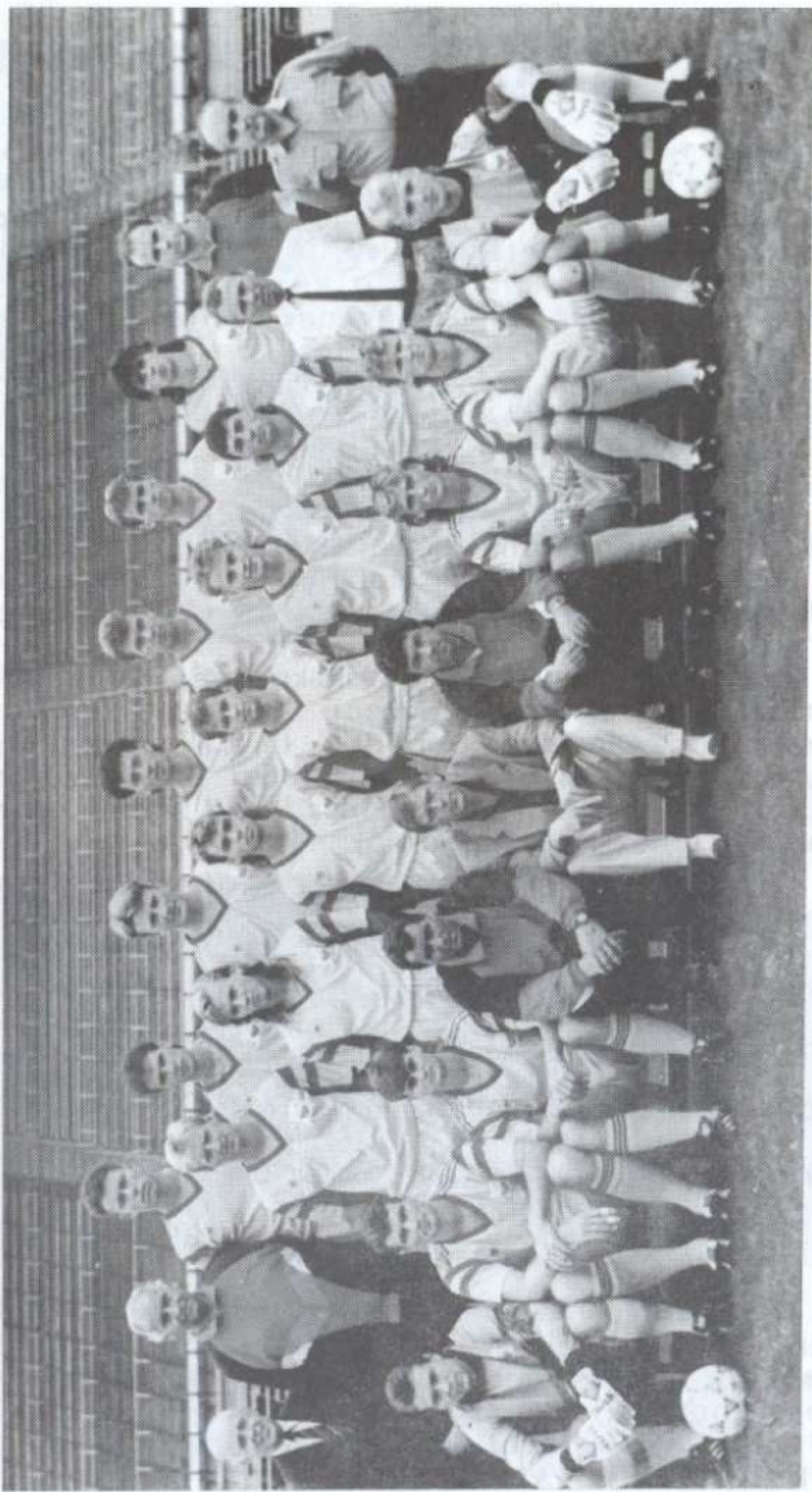
FC DUKLA PRAHA